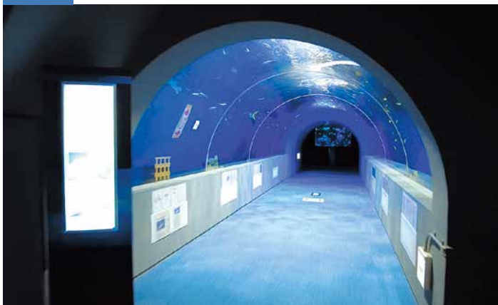
普段見られない水の底から魚の生態が見られるトンネル水槽