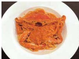
全国にファンを持つ「ワタリガニのトマトクリーム」

店内にお洒落な雰囲気漂うイタリアンの名店。幅広い年代層に支持されており、ファミリーからお一人様、シニア層まで足を運ぶ。人気メニューは「ワタリガニのトマトクリーム1,250円(パスタ)」。濃厚なワタリガニの香りとトマトクリームのバランスが絶妙な一品。野菜はできる限り無農薬のものをと自家栽培にも取り組む。コツコツと地元岩泉に根を張りながら絶品イタリアンを提供し続ける店。