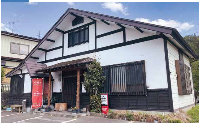
国道455号沿い、和食処風な外観でいて、実は絶品イタリアンの名店